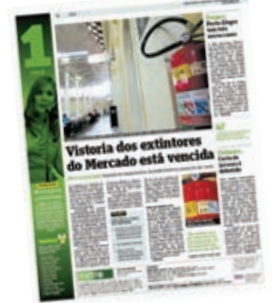
Metro denunciou o problema